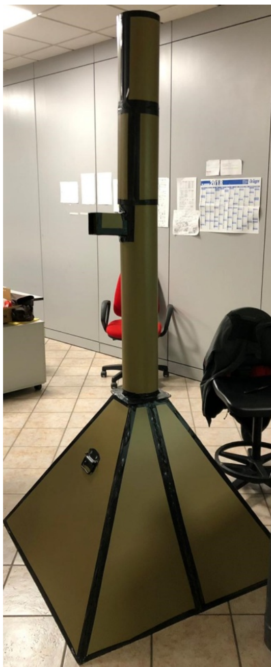
Cappa statica CAE